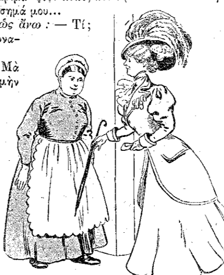
«Περᾶστε, κυρία Κλεοπάτρα...» (Σελ. 20, στ. γ')

ΔΙΣ ΑΓΚΑΘΙΔΟΥ: — Εἶνε γυναῖκα; ΦΛΩΡΑ, διστάζουσα: — Μὰ... μού φαίνεται, νά!