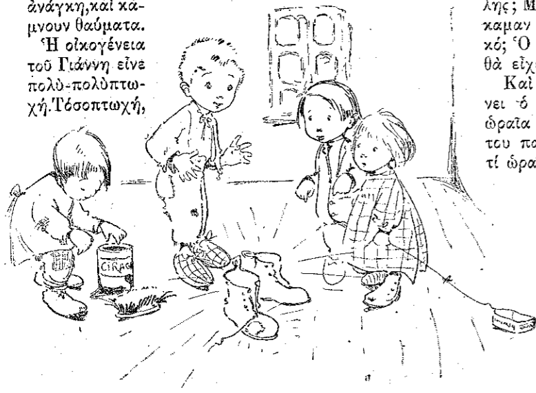
«Τὰ ἔκαμε κ' ἐγυάλισαν σὰν καθρέφτες...» (Σελ. 20, στ. β')

Η οικογένεια του Γιάννη είχε πολύ-πολύ πτωχή. Τόσο πτωχή,