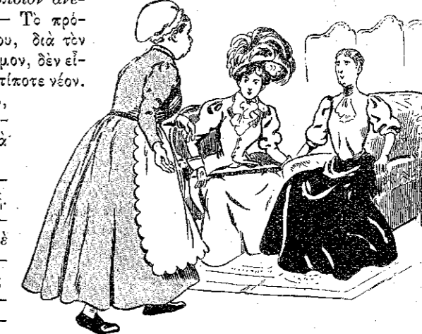
«Νὰ τὴν φέρω λοιπὸν μέσα...» (Σελ. 22, στ. α')

γουν και οἱ πλεον ἀμαθεῖς ἄνδρες... ἀλλὰ... ΔΙΣ ΑΓΚΑΘΙΔΟΥ: — Δὲν ἔχει ἀλλὰ! Ἀφοῦ εἴμεθα ἐν τῷ δικαίῳ, πρέπει νὰ τραβήξωμεν ἐμπρός, ἀδιαφοροῦσαι τί θὰ πῆ ὁ κόσμος. Και σύ, μού φαίνεται, εἰς τὴν τέχνην σου, τὸ ἴδιο κάμνεις. Πόσες φορές δεν ἤκουσε νὰ λέγουν διὰ τὰ ἔργα σου ὅτι εἶνε μαλλιάρᾳ! Ἀλλ' αὐτὸ δεν σ' ἔκαμε νὰλλάξῃς τρόπον ἐργασίας. Ἐτσι;